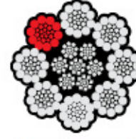
8x26 Warrington Seale